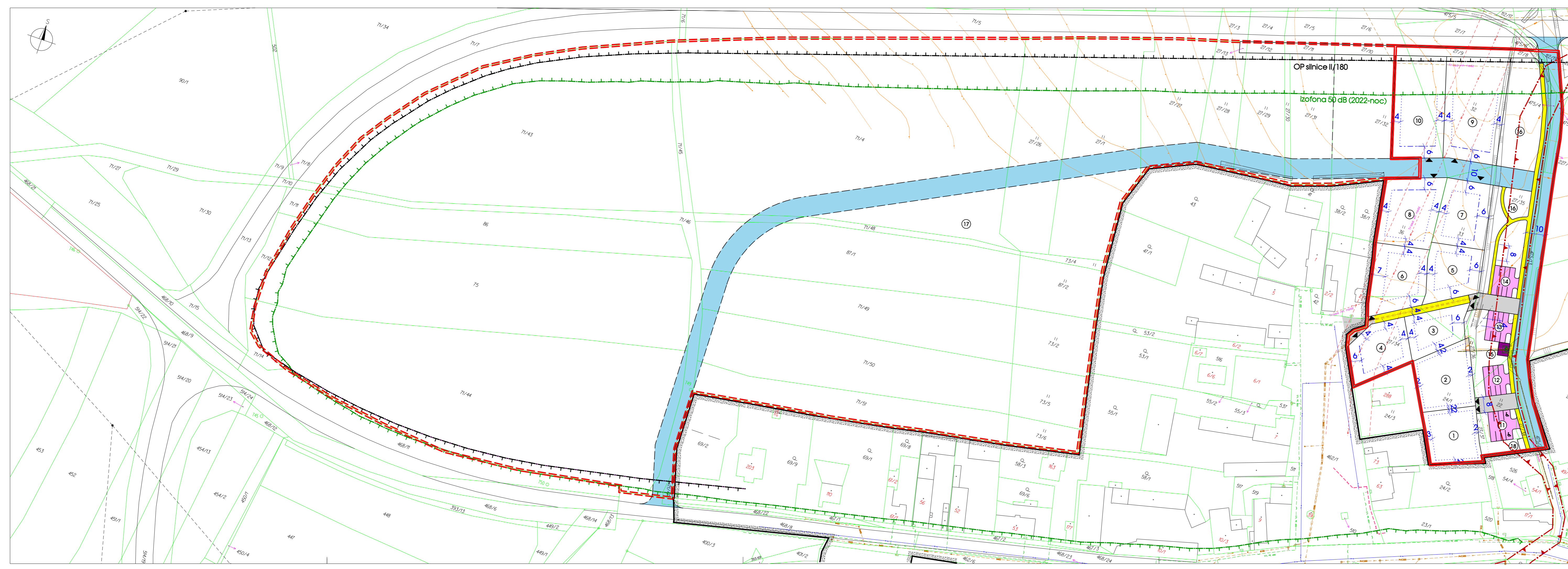
Obslužné komunikace C - šířka 10 m