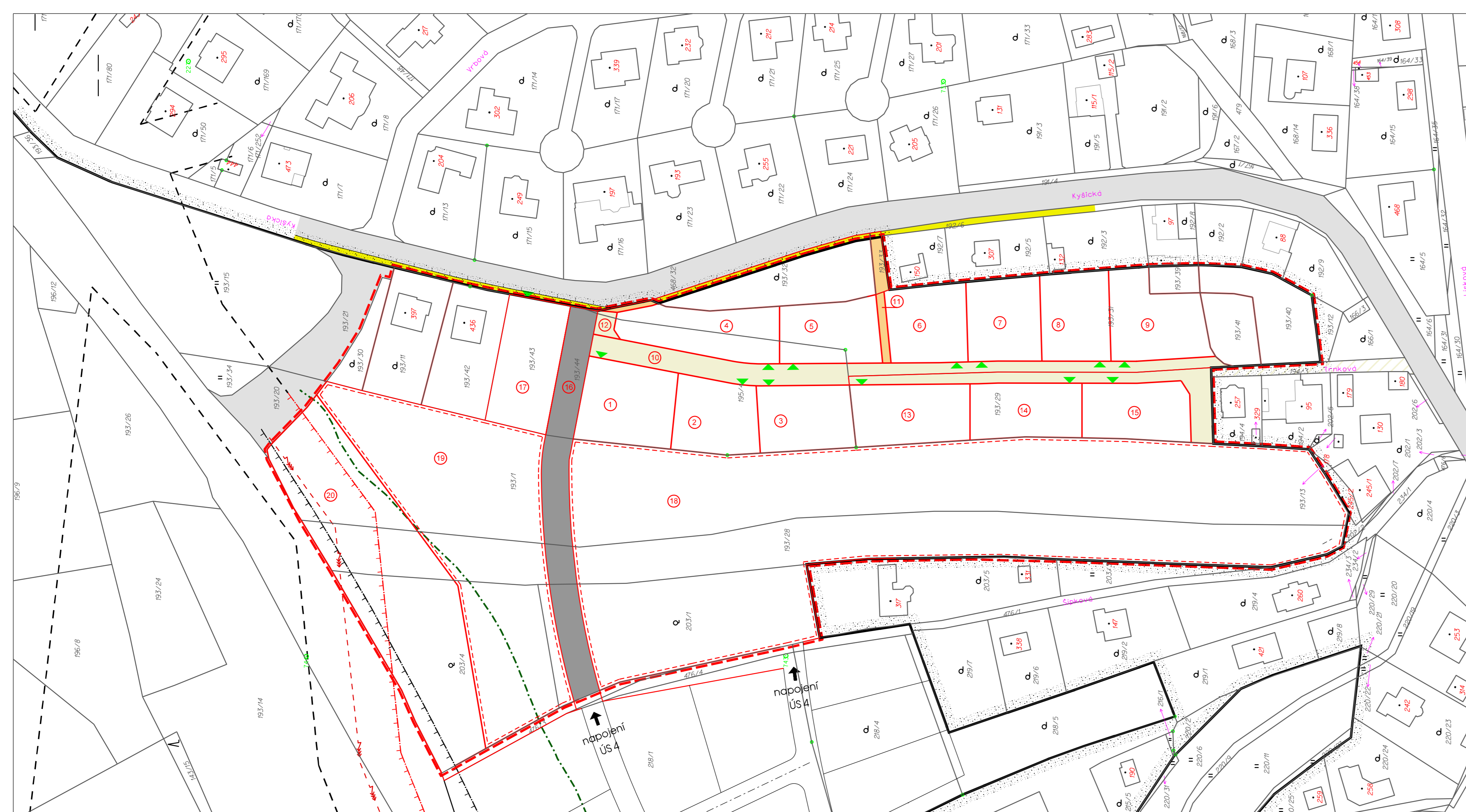
Schéma zklidňené komunikace D1 - šířka 8 m